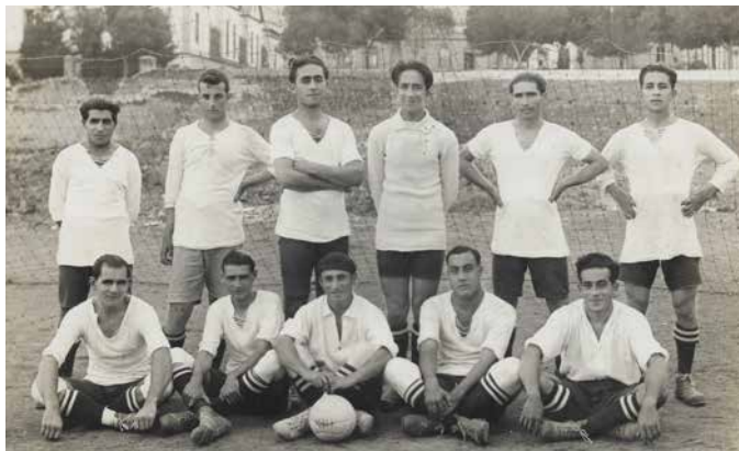
Formación del CD Tenerife del año 1922 en el desaparecido campo de fútbol de Miraflores.

Captación de socios. Otros acuerdos de la primera junta tuvieron que ver con la inscripción de socios, bien de número o protectores. Carente aún de sede social, a los interesados se les facilitaron formularios informativos en cinco establecimientos de la ciudad: la librería La Pren-