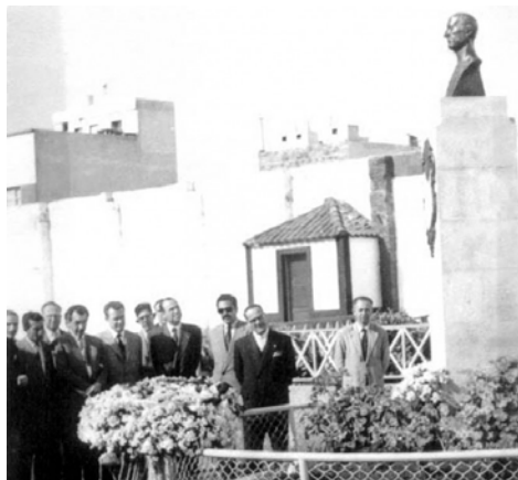
Acto de descubrimiento del busto dedicado a la memoria de Heliodoro Rodríguez López, que se celebró el 4 de marzo de 1951, en la explanada situada sobre la grada de Herradura.

De manera premonitoria, meses antes de su fallecimiento, el presidente comentó a sus colaboradores: “No