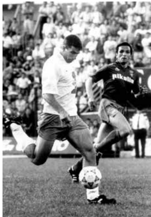
Juan Pizzi golpea el balón durante el Tenerife-Zaragoza de la temporada 91-92.