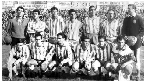
Partido Rayo Vallecano-CD Tenerife disputado en Madrid el 27 de noviembre de 1960.

competiciones nacionales, el Tenerife ya había vestido en dos oportunidades una camiseta blanqui azul a rayas verticales, con ocasión de sendas visitas a la isla del Real Madrid. En ambas ocasiones, el hecho obedeció a un gesto de cortesía con el equipo de la capital de España.