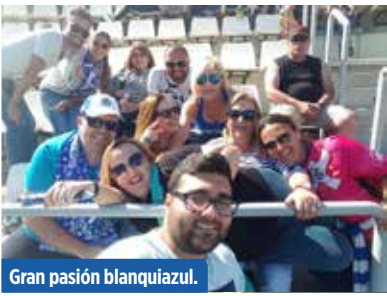
Gran pasión blanquiazul.