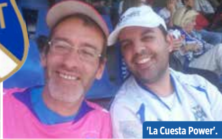
'La Cuesta Power'.