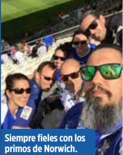
Siempre fieles con los primos de Norwich.