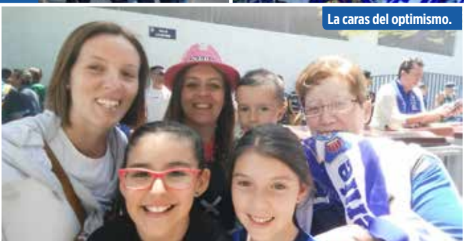
Las caras del optimismo.