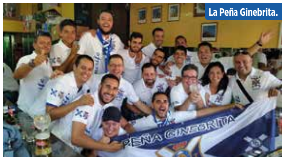
La Peña Ginebrita.