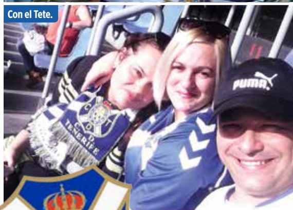
Con el Tete.