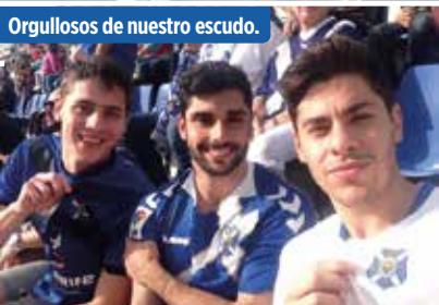
Orgullosos de nuestro escudo.