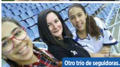
Otro trío de seguidoras.