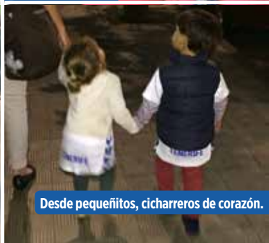
Desde pequeños, cicharreros de corazón.