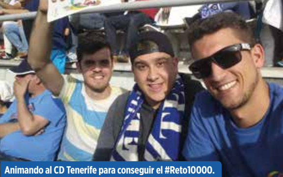
Animando al CD Tenerife para conseguir el #Reto10000.