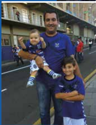
Siempre con el Tenerife.