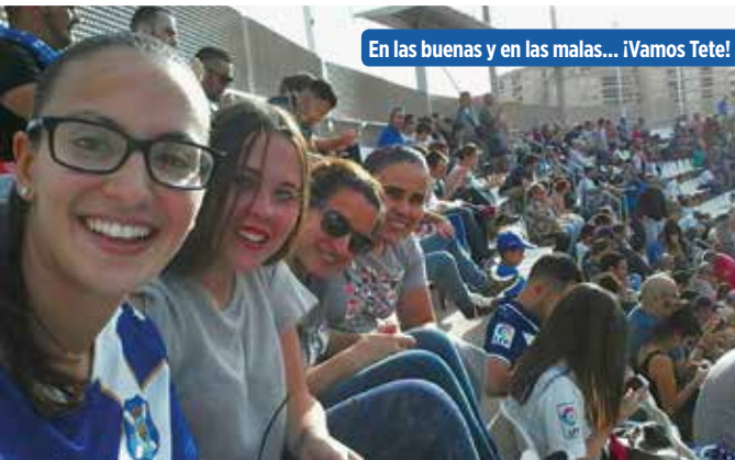
En las buenas y en las malas... ¡Vamos Tete!