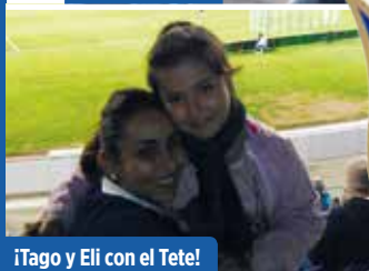
¡Tago y Eli con el Tete!

¡Envíanos tu foto! a info@botaheliodoro.com