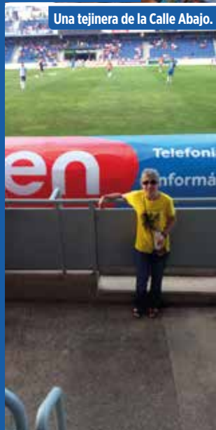
Una tejniera de la Calle Abajo.