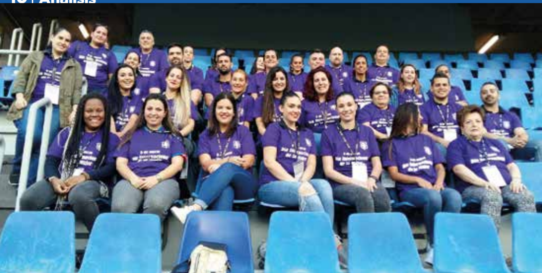
Representantes de la Asociación por el Deporte Femenino fueron invitados al Heliodoro Rodríguez López. CD TENERIFE