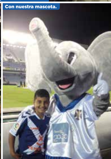
Con nuestra mascota.