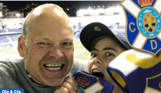
Ola & Cía.