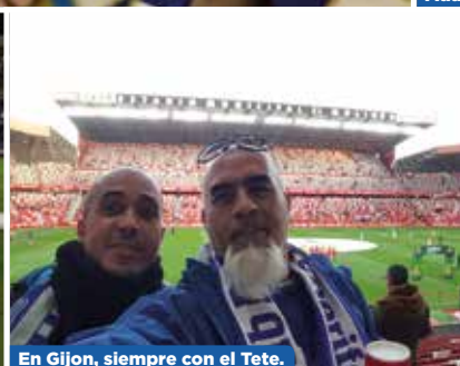
En Gijón, siempre con el Tete.