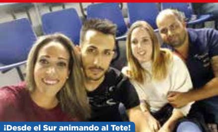
¡Desde el Sur animando al Tete!