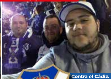
Contra el Cádiz.