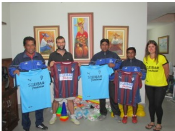
Llegada del material deportivo