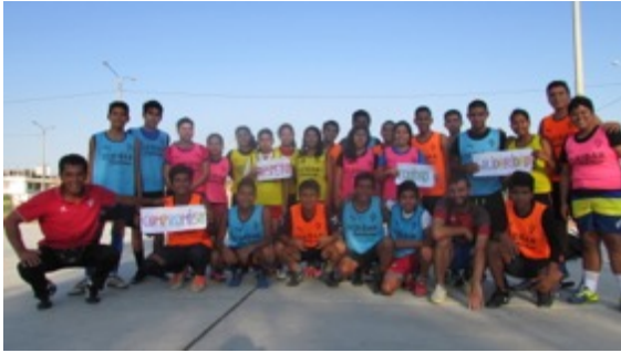
Promoción de valores