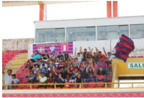
Afición e instalaciones