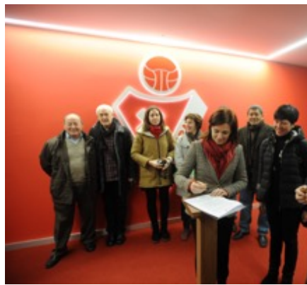
Firma del convenio SD Eibar + EGOAIZIA