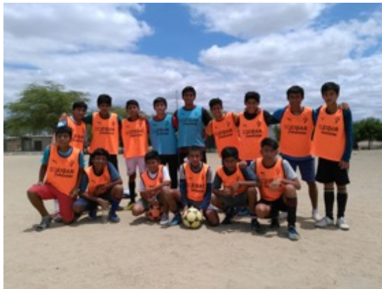
Equipación de Equipo Masculino