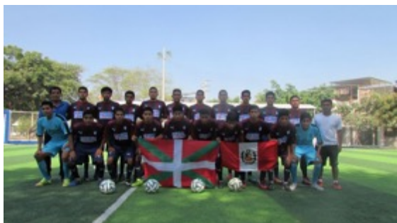
Equipación de Equipo Masculino