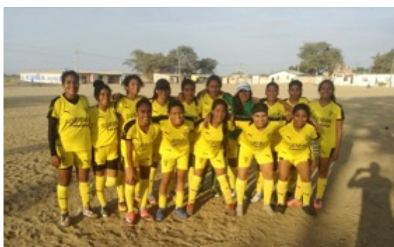
Equipación Equipo Femenino