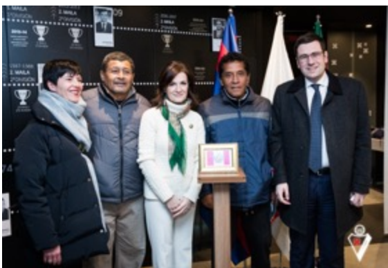
Asistencia a un partido del Eibar en Ipurua