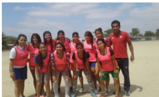
Equipación de Equipo Femenino