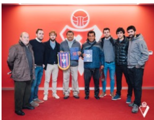
Reunión con los responsables de Cantera