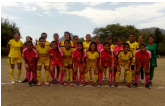
Equipación Equipo Femenino