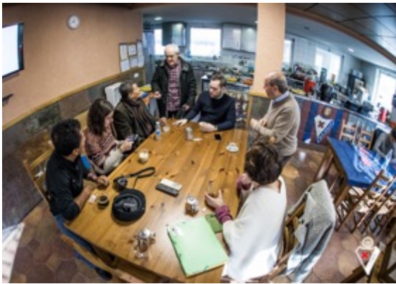
Visita a las instalaciones de la SD Eibar